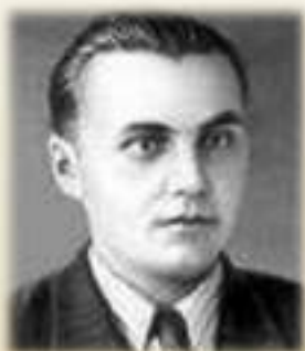
Василий Александрович Сухомлинский - педагога и директора Павлышской средней школы Кировоградской области, ученого и гуманиста