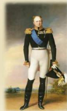
■ Александр I

Примерно с этого же времени начинает свой отсчет история создания детских парков, первый из которых был создан по приказу Екатерины II для ее внука, будущего императора России Александра I.