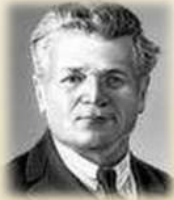
Станислав Теофилович Шацкий

Для истории дополнительного образования детей в России огромное значение имели педагогические концепции создателей первых экспериментальных внешкольных учреждений – С.Т. Шацкого и А.У. Зеленко.