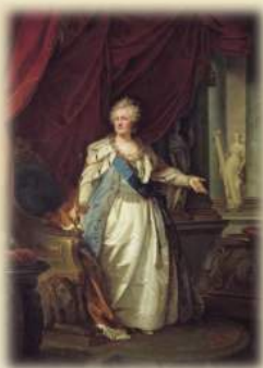
■ Екатерина Великая